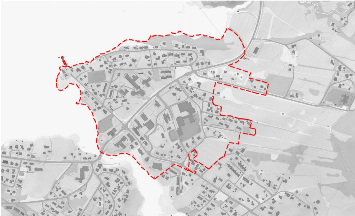
Figur 1: Plangrensen markert i rød stiple linje. Innskrenkinger kan bli aktuelt i løpet av planprosessen.