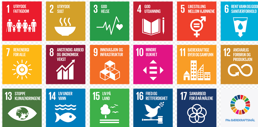
Figur 2: FN's 17 bærekraftsmål

Videre har regjeringen bestemt at FNs 17 bærekraftsmål, som Norge har sluttet seg til, skal være det politiske hovedsporet for å ta tak i vår tids største utfordringer, også i Norge. Det er derfor viktig at bærekraftmålene blir en del av grunnlaget for samfunns- og arealplanleggingen.